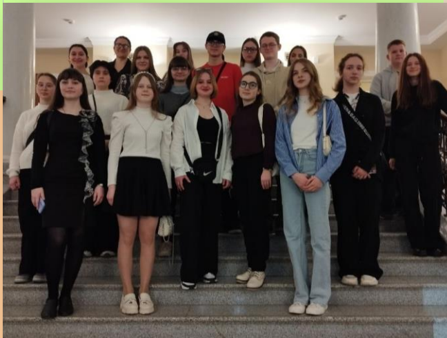
Прадстаўнікі клуба рэдактараў на экскурсіі па Нацыянальным тэатры імя Янкі Купалы