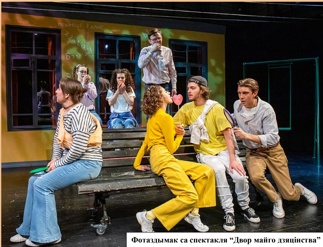
Фотаздымак са спектакля «Двор майго дзяцінства»